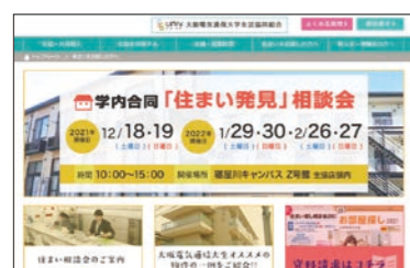
画像の一部は昨年版のものです